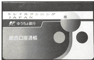
晴れて完成した「トレイルランニング JAPAN」という団体名の通帳

アマゾン：「金額を入力」の欄に希望額を書く。メッセージも入るし、送信日も1年先まで予約できる