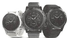
日本の発売が遅いものは海外通販で真っ先に入手！（ガーミンfenix5シリーズ）