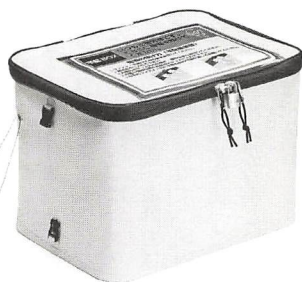
サンワダイレクト 宅配ボックス 30ℓ 4,980円 各種大きさあり

通販の注文はインターネットでラクラクだけれど、受け取る手間は昔とあまり変わらない。家で待つのは気が抜けない(?)し、コンビニ受け取りや営業所留めができない場合もある。マンションなどで宅配ボックスがあれば問題はないのだが、ウチには設置されていない...そんな問題を解消してくれる宅配ボックスがある。