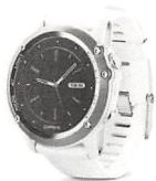
海外モデルのみ展開されるカラーもある（ガーミンfenix3）